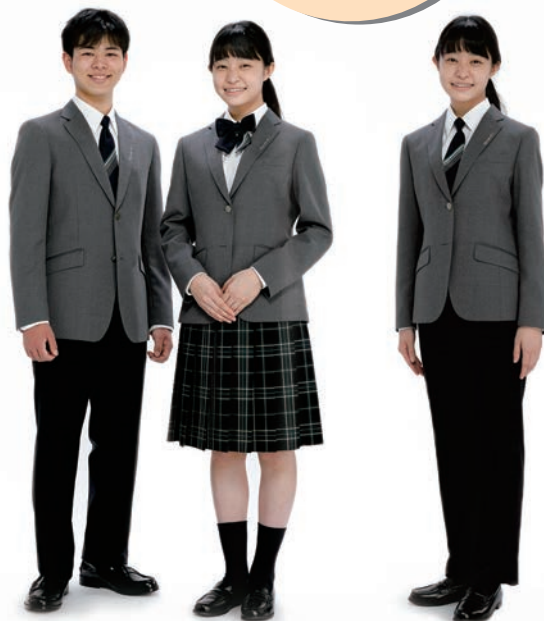
★令和3年度より新制服になりました★