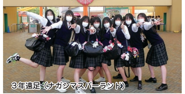
3年遠足 (ナガシマスパーランド)