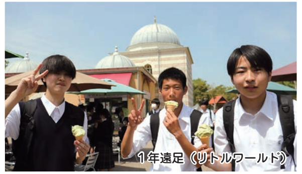
1年遠足 (ツトルワールド)