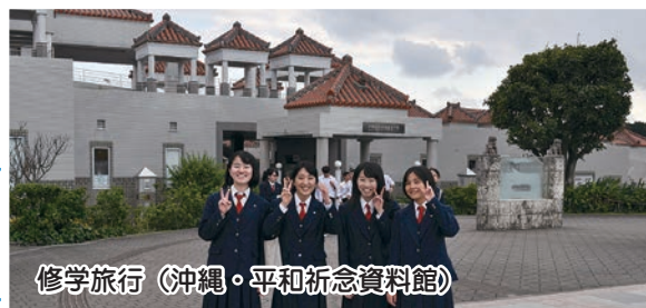
修学旅行 (沖縄・平和祈念資料館)