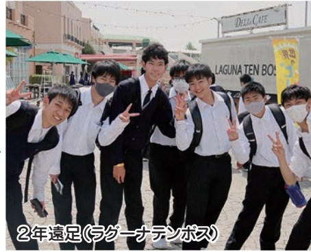
2年遠足 (ラグーナテンボス)