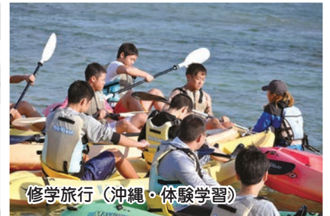
修学旅行 (沖縄・体験学習)